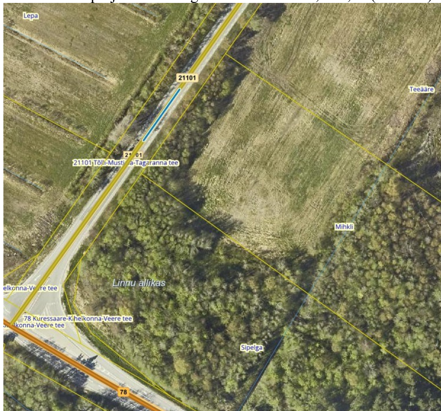
Joonis 1. Riigitee km 0,11-0,14, väljavõte Maa- ja Ruumiameti geoportaalist